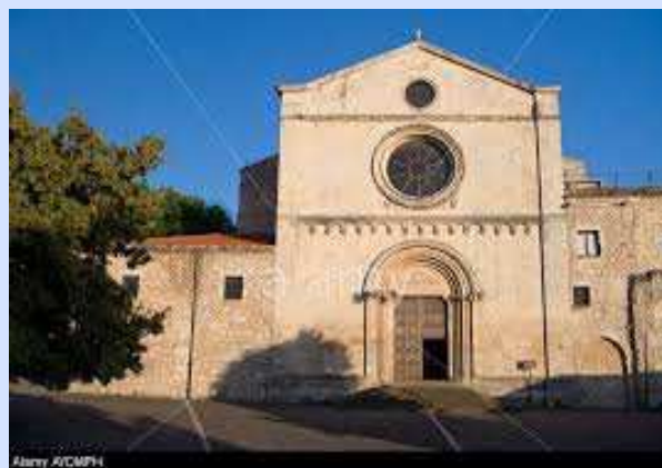
Chiesa di Santa Maria di Betlem in Sassari